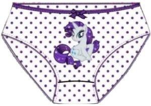
Трусы для девочки р 92 170 Передняя часть 1дет.

170 164 158 152 146 140 134 128 122 116 110 104 98 92